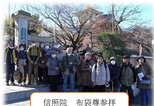
信照院 布袋尊参拝 家庭円満の神様

武蔵陵墓地は大正天皇・皇后（多摩御陵・東御陵）、昭和天皇・皇后（武蔵野陵・東御陵）と4基の御陵が造営されている。参道は厳粛な雰囲気があり、心が洗われるようなパワーも感じられた。1月7日の「昭和天皇祭の儀」の準備も整っており、天皇陵を意外と身近に感じた「歩こう会」であった。2日後のTVには同じ場所で拝礼される佳子様姿が放映されていた。